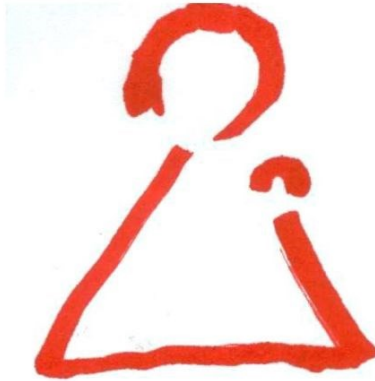
Cofradía Virgen de Gracia Belmonte Cuenca